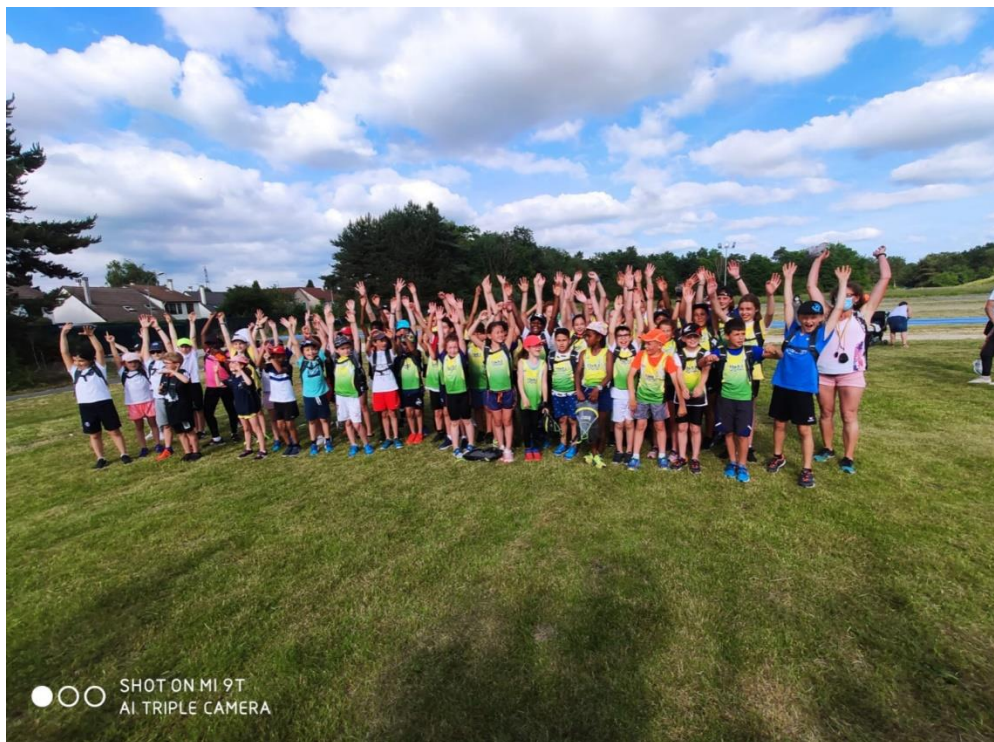
L'ensemble des représentants du club à la rencontre sportive de Tournan

Nos cadettes/juniors ont également représenté le club lors du meeting de Meaux le 25 juin (1500m) et à la soirée de St Maur le 30 juin (800m).