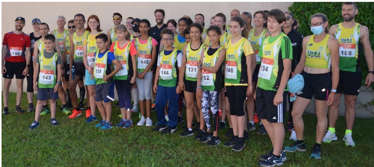
Une belle représentation à Presles en Brie avec 25 adultes et 15 jeunes